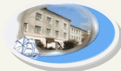
Проект учеников гимназии №13 «ПУТЕВОДНАЯ НИТЬ»