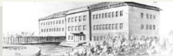
Школа №46. 1936 г.—Гимназия №13 2014 г.