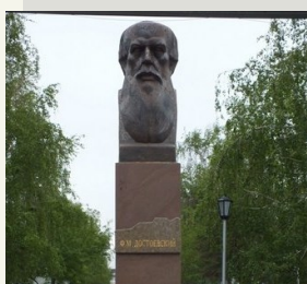
Бюст Ф.М. Достоевского установлен на аллее Красного проспекта при пере- сечении с улицей Достоевского.

г. НОВОНИКОЛАЕВСК. 1906 Масштаб 1:32 000