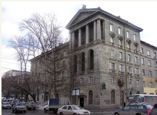
"Дом по улице Достоевского,14" построен в 1955 году. Архитектор Н. Ф. Храпенко. Многоквартирный жилье дом, памятник архитектуры (истории) .